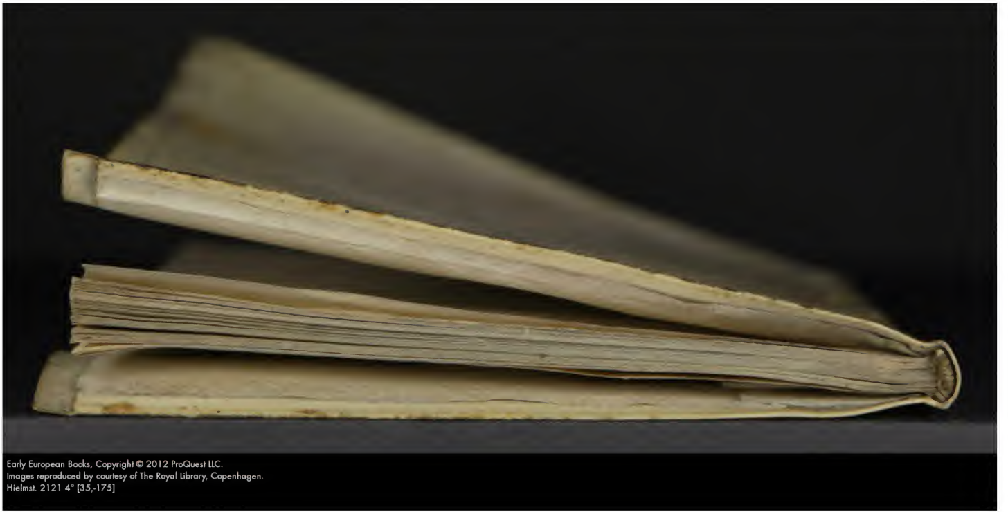
Hielmst. 2121 4° [35.-175]